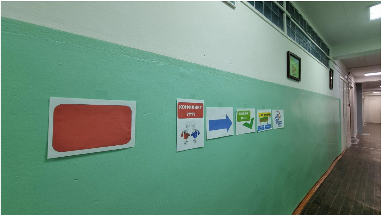
Оформление школьного пространства