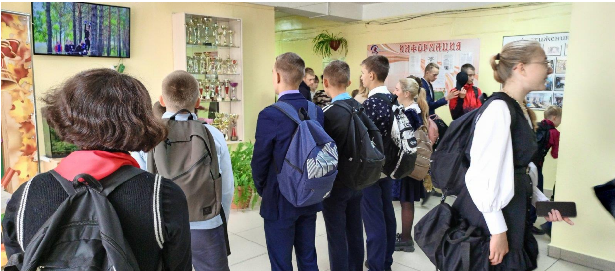
Видеоролик на первом этаже на тему «Я люблю тебя жизнь»