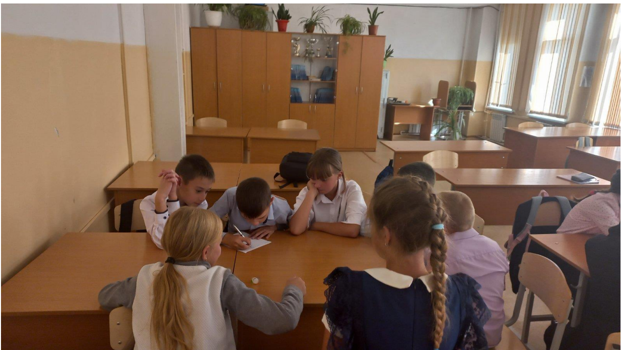
Занятие для подростков «Мои ценности»