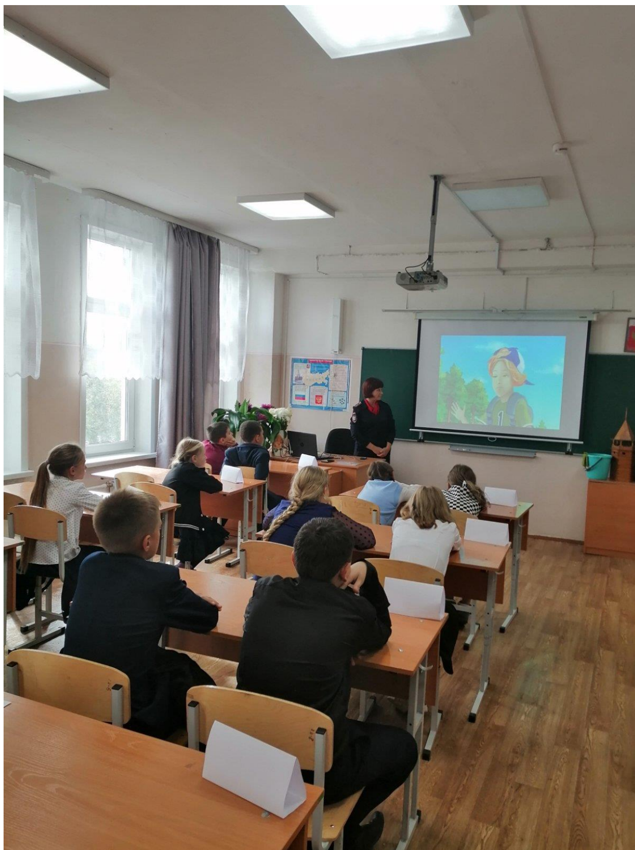
Профилактические занятия с обучающимися 5-11 класс проводят инспектора ПДН в рамках выездного заседания КДН